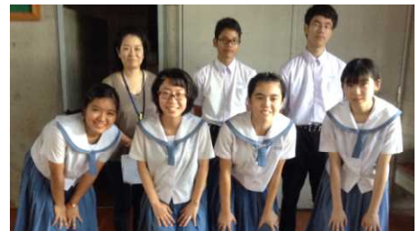
頑張ってくれた図書委員のみなさん

放送読書の取組を見て今年で3年目になりますが、今年が一番充実していました。音楽と放送原稿が一体になり、平和や命について深く考えることができたと思います。また、図書委員による体育館での読み聞かせも音楽やその歌詞から学ぶこともできました。与中ならではの自慢の取組です。