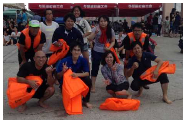
Tチーム、久しぶりの優勝です。