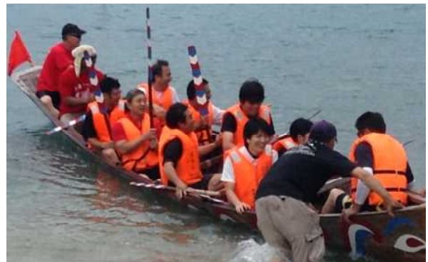
Pチーム頑張り、見事優勝！

21日(日)に当添区のハーリー大会が開催され、与那原中学校は、なんとP(保護者)チーム、T(先生)チーム、そろって優勝しました。校長先生が与那原中学校に来て、初めての優勝でした。いつも生徒のみなさんが部活の試合等で優勝しますが、今回は与那原中学校PTAもよくがんばりました。勝因は、折り返し地点のターンが上手だったことと思いました。参加したみなさん、おめでとうございます。お疲れさまでした。