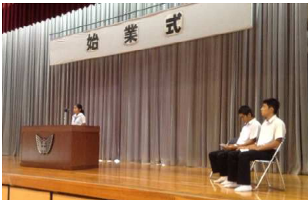
＜2学期の抱負を述べる学年代表生徒、始業式の様子＞