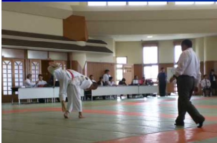
〈一本で勝利を決める与中団体の選手〉

20日(土)に開催された県新人柔道大会で、本校は男女ともに準優勝でした。おめでとうございます。男女ともに見事な勝利で一気に決勝戦へ、男子は南風原、女子は沖尚中が相手でした。健闘しましたが準優勝、夏の大会で優勝を手に入れてください。