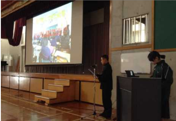
〈全クラスがパワーポイントで挑戦の達成状況を説明した〉

20日(金)に、各クラスの「挑戦」の最終発表会を体育館で開催しました。本校の「挑戦」は4月はじめに各クラスが1年間かけて挑戦(目標とすること)を定め、取り組み、その成果を発表するものです。本校はこの取組を10年以上継続しており、本校の伝統になりつつあります。各クラスの取組を数えると、今年度は41個ありました。これらは、学級や学校生活を良くするものであり、大切な取組です。この取組を通して、「団結することの大切さを学んだ/時計を見て行動するようになった/給食の好き嫌いが減った/笑顔が増え、クラスが仲良くなった」など成果を発表しました。1年間、みなさんが頑張って取り組んできた「挑戦」で学校がすばらくなってきていることも事実、ご苦労様でした。