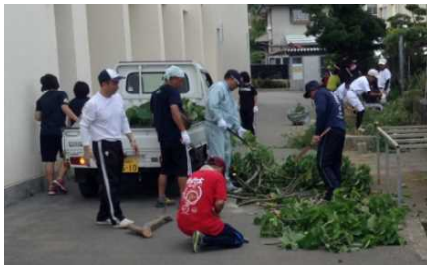
＜軽トラックに枝等を積み込む生徒、保護者＞

6月28日(日)に本校のPTA作業が実施されました。草刈りや枝打ちなど、日頃学校でできないところを、お父さん、お母さん方に手伝ってもらい、学校が大変きれいになりました。心からお礼申し上げます。ありがとうございました。今回は、以前よりもたくさんの保護者に協力をいただきました。1年18名、2年26名、3年26名、合計70名のみなさんに協力していただき、当初計画していた作業区域を時間内に終わることができました。また、当日は、野球部やテニス部などたくさんの部活動生徒のみなさんも協力してもらいました。生徒のみなさんもお苦勞様、そしてありがとうございました。