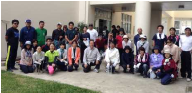
＜作業始めの恒例の記念撮影＞

6月28日(日)に本校のPTA作業が実施されました。草刈りや枝打ちなど、日頃学校でできないところを、お父さん、お母さん方に手伝ってもらい、学校が大変きれいになりました。心からお礼申し上げます。ありがとうございました。今回は、以前よりもたくさんの保護者に協力をいただきました。1年18名、2年26名、3年26名、合計70名のみなさんに協力していただき、当初計画していた作業区域を時間内に終わることができました。また、当日は、野球部やテニス部などたくさんの部活動生徒のみなさんも協力してもらいました。生徒のみなさんもお苦勞様、そしてありがとうございました。