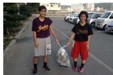
女子バスケ部、チリ拾い

本校では、毎朝ボランティア活動を頑張っている部活動があります。8時前の時間を利用して学校内をきれいにしてくれています。早登校を心がけ、清掃活動してくれていること、すばらしいですね。校長先生も感謝です。ありがとう。