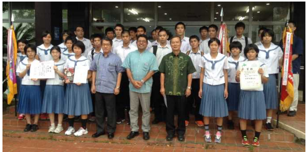
＜地区・県の夏季大会等の優勝旗や上位入賞の賞状を手に笑顔で記念撮影：役場前＞