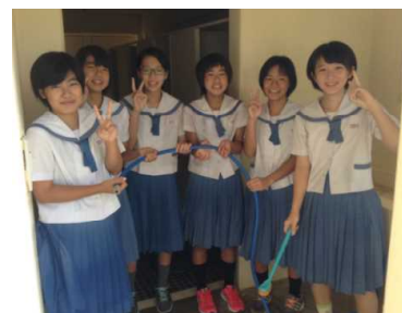
女子バレー部、グラウンドのトイレ掃除

本校では、毎朝ボランティア活動を頑張っている部活動があります。8時前の時間を利用して学校内をきれいにしてくれています。早登校を心がけ、清掃活動してくれていること、すばらしいですね。校長先生も感謝です。ありがとう。