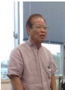
＜議会对応で多忙な中、時間をつくって挨拶をいただいた古堅町長＞