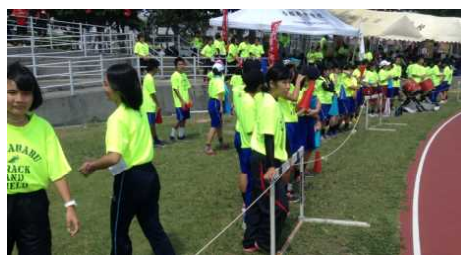
安全で楽しい 秋休みに！