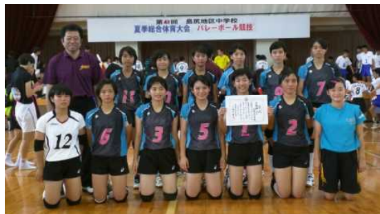
〈6.7月 みんなで力を合わせ頑張った夏季大会〉