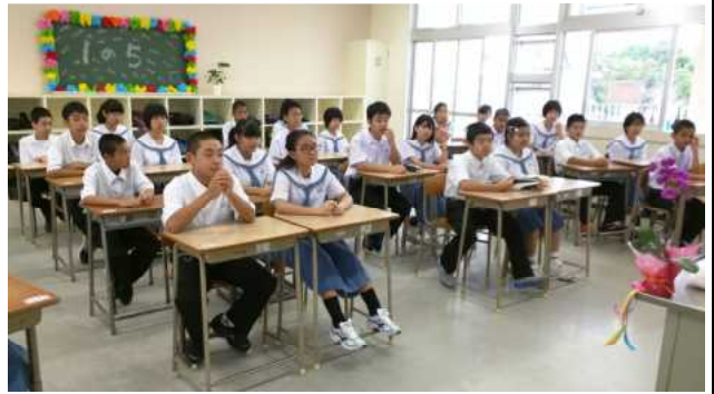
〈1年生入学式翌日8日、5組学級での様子〉