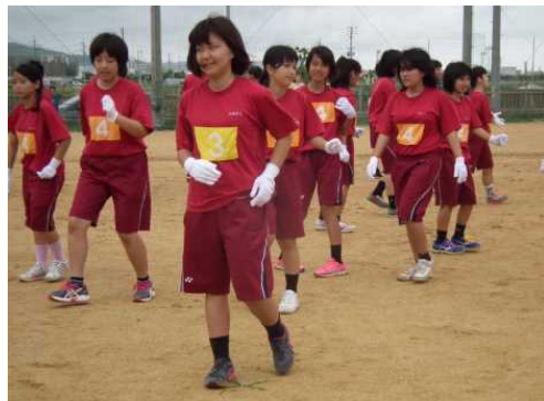
五月校内スポーツ大会 クラスの団結深まる。