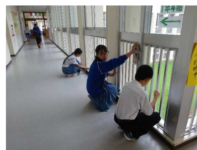
8:00 窓拭きをする美術部