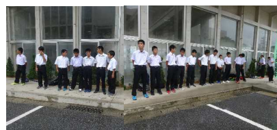
7:55 あいさつ運動のサッカー部

本校では「8時だよ！全員集合」の合言葉のもと、8時までの登校を奨励しており、多くの生徒が8時までには登校し、それぞれ活動しています。部活動に所属している生徒は、それぞれの部で練習に取り組んでいたり、校舎内外の掃除や朝のあいさつ運動と部独自の活動をしています。さらに、部に所属していない生徒は、学級で読書や学習等自分で考えて活動をしています。8時10分頃には、どの学級においても静かに読書・朝自習に取り組んでいます。そのような朝の活動が、一日のリズムを整え、ゆとりを持って学校生活を送ることができるのではないかと思います。8時までの登校、今後ご協力をお願いします