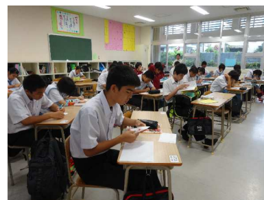
8:10 朝の自習をする3年生

4月28日（木）の朝8時15分から40分までの25分間沖縄県警察本部少年サポートセンターから講師を招いて、携帯電話やパソコン等の身近な情報通信機器の活用とマナーについて考える機会として、標題の講演会を実施しました。講演会は「SNSはあなたの人間性を映し出す鏡です。」で始まり、ネット活用は相手への思いやりが大切である。たとえば、私たちは日常生活で相手にハサミを渡すときに、刃先を相手に向けて渡すことは決してしない。そのような思いやりが、ネット上でも絶対に必要である。と強調していました。また、ネット活用の向こう側には、私たちの知らない悪意を持った活用者がいるとの認識に立って活用しないと、とんでもないことに巻き込まれる場合があると事例を交えながら説明していました。何気なく使っているネットですが、被害にあってからでは遅いです。これからの時代ますますネット活用が必要になると考えられます。しっかりした活用方法を身に付けることが大切です。活用についての親子の話し合いをお願いします。