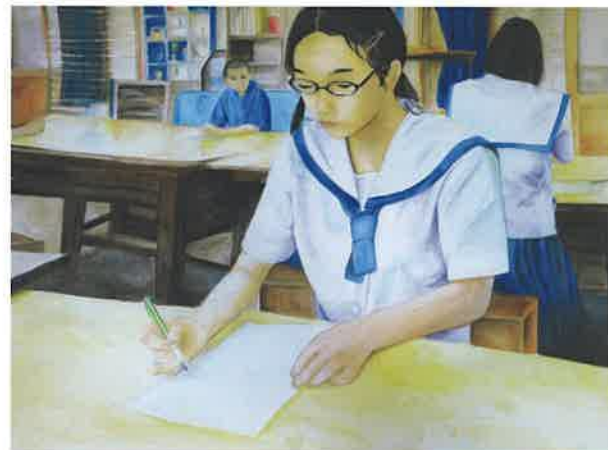
全琉図画作文書道コンクール最優秀賞作品