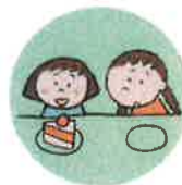
他のきょうだいとは著しく差別的な扱いをすること