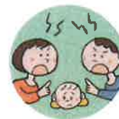
配偶者への暴力や暴言をこどもに見せること