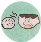
言葉で脅したり、脅迫すること

体罰は暴力でこどもの身体を傷つけるもので、心理的虐待は暴言などでこどもの心に深い傷を負わせるものです。こども本人への暴言でなくとも、配偶者や家族に対する強い言葉などもこどもの心を傷つけ、発達に影響する可能性があります。