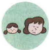
こどもを無視したり、拒否的な態度を示すこと