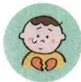
こどもの心や自尊心を傷つけるような言動をしたり、繰り返し言うこと