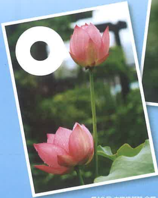
第16回 中学校部門 金賞 【自然のストーリー】