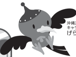
沖縄21世紀ビジョン キャラクター げら系2121